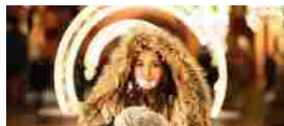
Soggiorni studio all'estero per Vacanze di Natale last minute