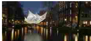
Amsterdam, l'arte che illumina la città

L'entroterra viterbese è uno spettacolo ricco di storia, natura e piccoli borghi dalle antiche tradizioni: visitare la Toscana nel periodo natalizio permette di apprezzare e scoprire le tante anime che [...]