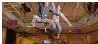
Trento, notte al museo solo per adulti