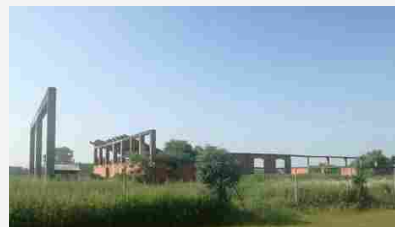
Appartamenti Strada Cigliano snc - 115470