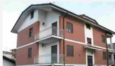
Appartamenti Perosa Canavese Via Adriano Olivetti, 20 - 126192