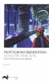
NOTTURMO BIZANTINO LUIGI DE PASCALIS COLLEZIONE CONOSCERE

Decimo imperatore della famiglia Paleologo, Costantino XI ha poco meno di cinquant'anni quando Costantinopoli viene conquistata dal sultano turco Mehmet II, poco più che ventenne. Siamo nel maggio del 1453 e nella caduta dell'Impero romano d'Oriente è facile cogliere anche i segni di una lunga decadenza senile, che finisce col precipitare dinanzi all'urto di una giovinezza impetuosa. È vero che la città resiste eroicamente e che lo stesso imperatore, spogliatosi delle insegne, combatte fino alla morte. Ma l'agonia bizantina era iniziata almeno nel 1420, in uno scenario che vedeva la Cristianità dilaniata da secolari divergenze religiose, e greci e latini avviluppati in conflitti e divisi da egoismi, interessi, pregiudizi. Al punto da non voler vedere il pericolo incombente di un Islam in tumultuosa espansione perché forte della sua fede e delle sue armi.